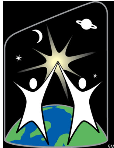
World Space Week SM