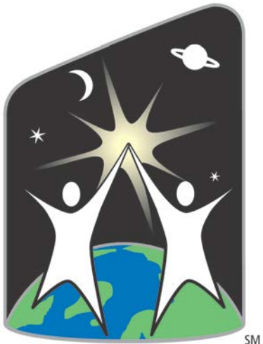
World Space Week SM October 4 - 10